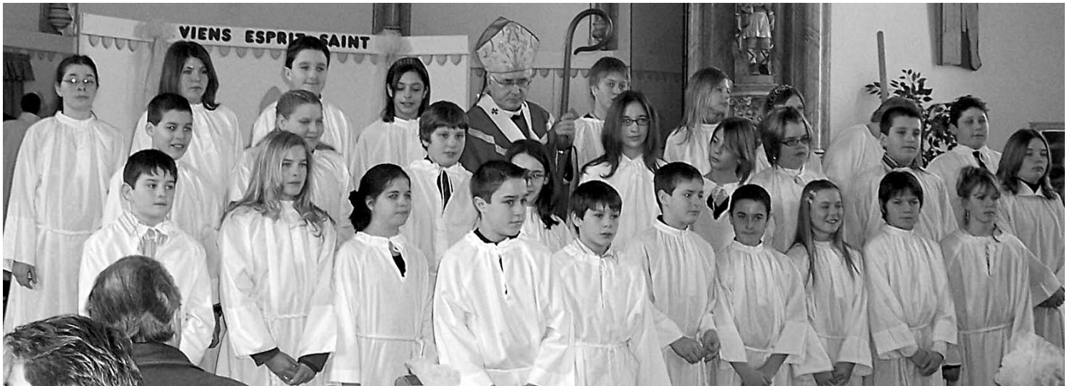
Confirmations aux paroisses St-Isidore et St-Bernard