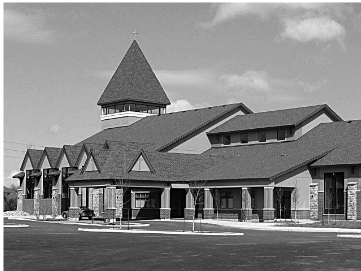
Nouvelle église de la paroisse Holy Spirit, Stittsville, bénie le 31 mars 2008

à chaque eucharistie (voir 1 Corinthiens 11,23-26). De plus, tout au long de l'année liturgique, nous lisons à la messe des extraits des lettres qu'il a adressées aux membres des communautés chrétiennes ou à des individus. Vingt siècles après sa mort, ses écrits sont encore scrutés, médités, priés. Ses lettres regorgent du zèle qui l'a fait parcourir des distances énormes pour proclamer la Bonne Nouvelle du salut en Jésus Christ. Saint Paul est le converti qui aura le plus influencé la vie des chrétiens et des chrétiennes de tous les temps.