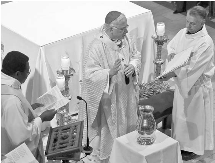
Messe chrismale de janvier 2008