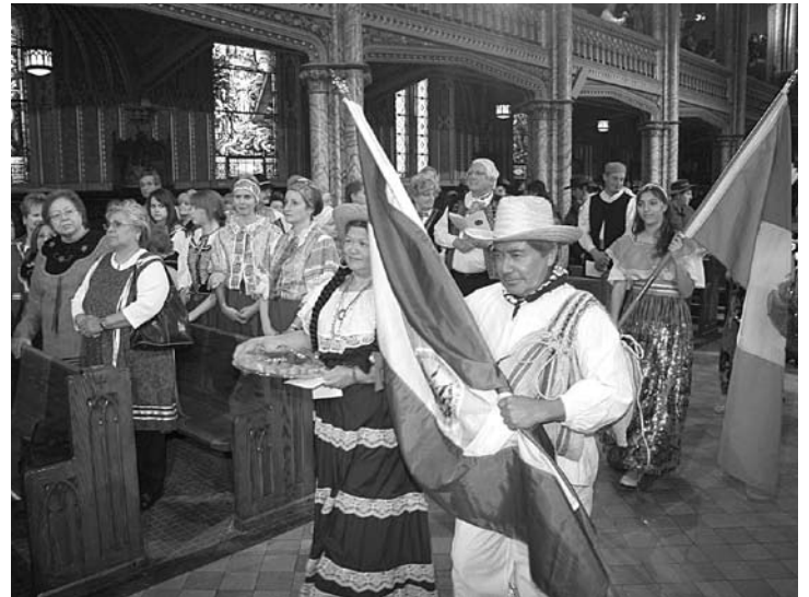
Participants de la Messe multiculturelle de janvier 2008